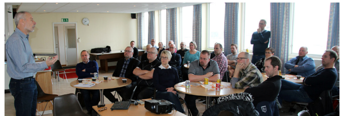
I samband med Produktionslyftets avslutning på Berco genomfördes även ett inspirationsseminarium för andra intresserade företag. Totalt deltog ett 30-tal personer från tio olika företag.

Arbetet gav mersmak och när möjligheten kom att delta i Produktionslyftets fördjupningsprogram var de inte sena att anmäla sitt intresse. Berco önskade nu att anpassa produktionen i enlighet med sin nya strategi, framförallt genom att: