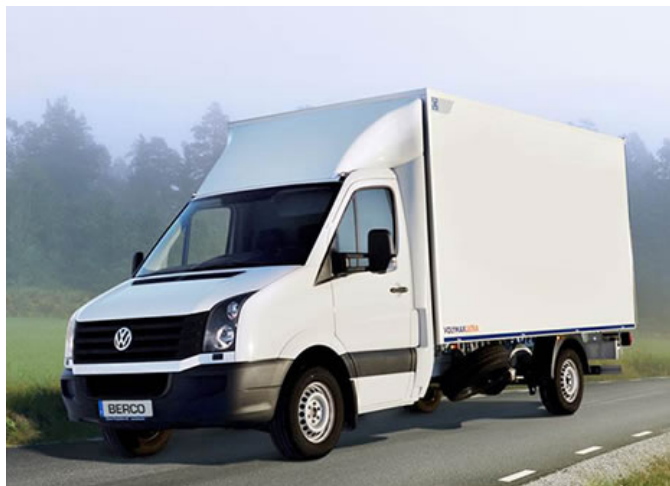
Produktexempel; Berco Multifunktionsskåp.

En anledning till ökad efterfrågan är att de tagit fram ett helt nytt skåp, 350 kg lättare än föregående modell vilket ökar nyttolasten till 1100 kg – bäst på marknaden för lätta lastbilar. Utvecklingen har skett med en "trattmodell" där målet på 1100 kg nyttolast triggade 45 idéer från produktionen, vilket i sin tur ledde till 10 konkreta förbättringar som klarade målet.