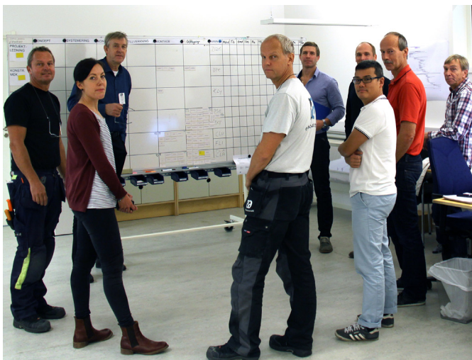
Delar av Elektroautomatikens personal på Hisingen i Göteborg framför en av planeringstavlorna.