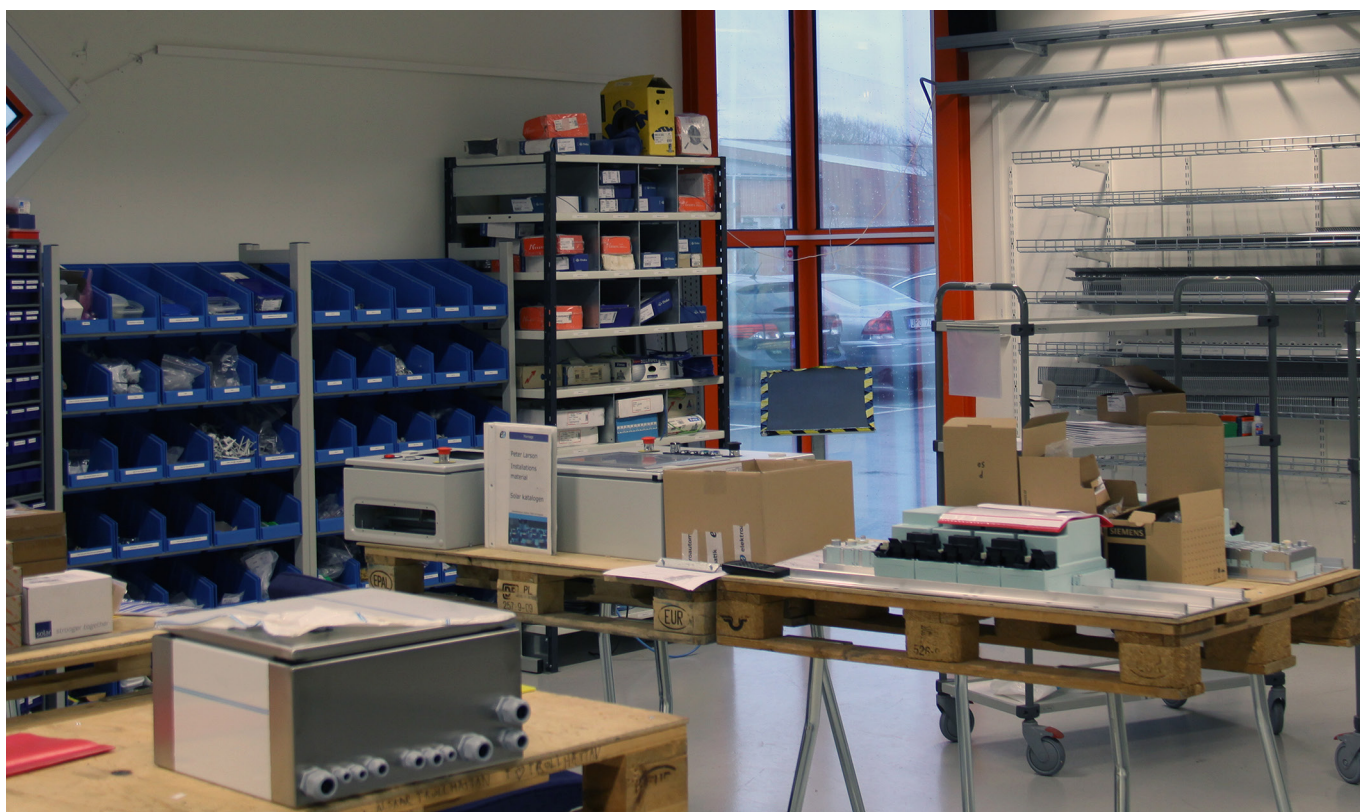
Rent, snyggt och välplanerat, en inte helt ovanlig syn hos Produktionslyftsföretagen.

Istället för att skicka två obligatoriska medarbetare till Produktionslyftets Lean-utbildning, valde EA att skicka fem stycken för att säkra spridningen i företaget. Dels med tanke på att de förutom de 90-talet fastanställda medarbetarna även kan ha upp till ett 100-tal inhyrda, dels med tanke på att de bedriver verksamhet på tre orter: Göteborg, Skövde och Västerås.